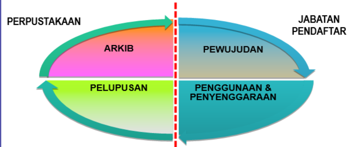
Rajah 1 : Peranan Jabatan Pendaftar dan Perpustakaan dalam Kitar Hayat Rekod.