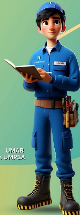
UMAR Ikon UMPSA